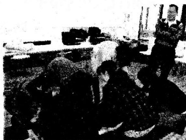
担架の作成と搬送訓練