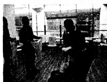
三角巾の使い方講習