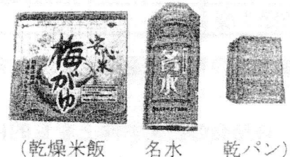
(乾燥米飯 名水 乾パン)

「名水」は現在、市上下水道局で限定販売しています(1箱 1500円 24缶入り<広報なごや7月号>)。不測に備えて日常生活の中でそれとなく用意しておきたいものだと思います。